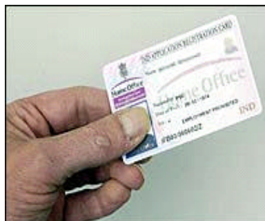
生体認証型ICカードサンプル

16歳から25歳の若年者（2010年）、UKのパスポート取得者ないしイギリス人一般（2011年）に拡大の計画。