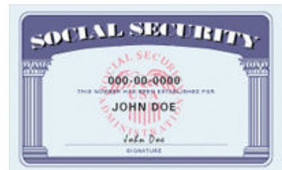
社会保障番号(SSN)カード・サンプル

—— わが国で社保卡が導入されたとする。IC仕様のSSNカードは、身分証明(ID)カードとしても使える方向。となると、ICカード表面に氏名・生年月日・住所などの基本情報が表記されることになる。それに、社保卡は医療機関とか民間機関でも使用とのこと。つまり、カードに格納される背番号(住基コード、識別番号など)は民間利用にも拓かれる方向。となると、私たちは、医者や介護業者などからサービスを受けるときには、各人の基本情報や背番号などが詰ったSSNカードを提示。医者や業者は、ICカードから、基本情報、さらには内蔵された背番号など秘匿性の高い情報(SSNカード情報)を入手