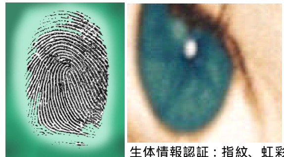
生体情報認証：指紋、虹彩

—— ブレア政権の生体認証情報式IC仕様の身分証明（ID）カード導入計画におけるサプライズは、居住者全員に背番号を付けること。これは標準仕様だとして、各人の目玉の虹彩あるいは人相、手の指紋といった生体認証（バイテク）情報を収集するというのが、それこそ“目玉”。そうしたバイテク情報を国家が画像処理した上で、NIR・国家ID管理センターで集約管理するとともに、それらをICカードに入れて本人に交付して身元証明に使おうというもの。約450万の居住外国人と海外居住者を含む約6千万イギリス市民権保有者の生体認証情報および広範な個人情報は情報処理され、国家データベースである「国家身分証明登録台帳」（NIR = National Identity Resister）で集約的に管理。イギリスの“国民総IDカード制”は、生体認証（バイテク）情報の採取もあるという意味で、「国民総背番号制」の“ニューバージョン”。このニューバージョンにおいて、最も真新しい提案は、本人の生体認証情報の採取、官民にわたる諸機関での本人確認目的での利用、捜査機関などへの提供。ただ、指紋以外の生体認証情報については、何を採用するか、正式には未定……。法律では、内務大臣が政令で決められる（法3条6項）。ともかく、この「身分登録証明（ID）カード法案」は、イギリスでの「バイオメトリクス」の本格的な“行政”、利用のきっかけに。高度な電子技術を駆使して国民を徹底監視できる「マスターキー・カード」の創設。