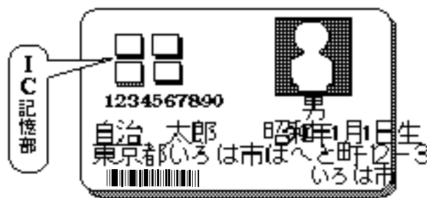
カードにバーコードを付ければ、コンビニでも使える？

一方、背番号コード情報などを記録した全国共通の国民登録証（ID）カードは、市区町村が発行することになる。顔写真入りとし、身分証明証として使わせようと自治省はもくろんでいるようだ（図2）。また、IC（集積回路）カードで、最高八千文字書き込める（書き換えも可能な）ものを想定しているようだ。書き込みの内容は、各自治体の判断による。 問題なのは、自治省がかなり前から